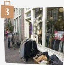
LANGE BRUG 20-G