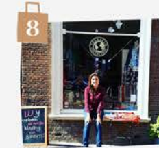
LANGE BRUG 43

Maak een wandelingetje over het Rapenburg, de mooiste gracht van Leiden. Hier zijn ook het Museum van Oudheden en de Hortus Botanicus te vinden. Tijd voor cultuur.